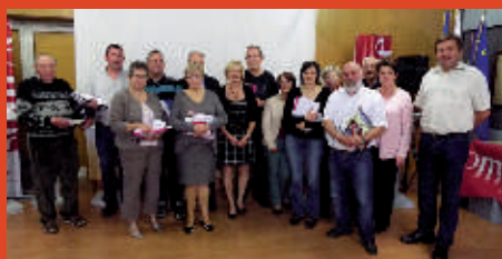
Poix de Picardie

UN JEU-SPECTACLE ouvert à tous, pour découvrir les richesses de votre département